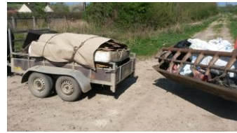
Pendant le nettoyage

A savoir que des frais ont d'ores et déjà été engagés à hauteur de 3500€ dans le cadre d'une réfection de matériel d'entretien communal (train avant du tracteur, lame de coupe...).