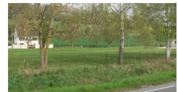
Les abords du stade APRES

Pour rappel, vous trouverez ci-dessous en encadré les textes de lois et peines encourues pour tout abandon de déchet.