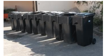
Une partie des déchets collectés à l'Oise