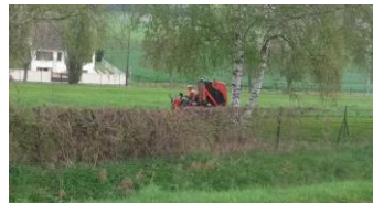
Les abords du stade AVANT