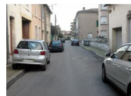
Illustration stationnement gênant