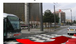
Libre accès pour les véhicules de large gabarit