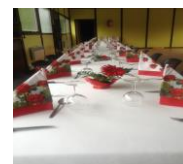
Repas des aînés 2013

Rappelons que la municipalité organise son repas annuel des aînés le dimanche 26 octobre . Chaque habitant âgé de 60 ans ou plus a reçu une invitation personnelle et devra donner réponse à la mairie au plus tard le 3 octobre.