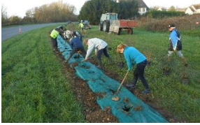
Que la terre est basse

L'aménagement de la déviation de la D13 faisait partie des missions d'entretien et d'embellissement de notre village que nous nous étions fixées. Chose est faite depuis le 29 Novembre passé.