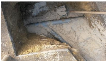
Canalisation PVC en Y

Lors d'une réunion préparatoire au démarrage du chantier d'électrification de la Cavée du Moulin et de la partie haute de la rue du Grand Ferré (tranche ferme du marché), où nous avons demandé par un avenant que soit réalisé le renforcement de la rue des Fontaines, à titre gracieux , la société INEO a accepté d'assurer le captage des eaux de sources de cette rue, par la pose d'un avaloir à la hauteur du croisement de la rue des Groseilliers avec raccordement sur le réseau existant et par la mise en place d'une canalisation en Y pour faciliter le circuit hydraulique de l'eau.