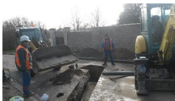
INEO en action