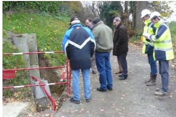
Réunion de chantier

Les travaux d'électrification de la Cavée du Moulin, du haut de la rue du Grand Ferré et le renforcement de la rue des Fontaines ont débuté le 17 novembre. Ils ont été précédés d'une réunion publique pour les Rivecourtois concernés le 3 novembre.