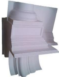
Chef d'œuvre, élément d'architecture en staff

Un parcours atypique mis en exergue dans "Le PARISIEN" (article du 24 octobre). Après une mise à niveau en ébénisterie, la sculpture sur bois lui permettra de parfaire son habilité. Actuellement en première année de brevet professionnel des métiers d'art au lycée du Gué-à-Tresmes de Congis-sur-Thérouanne (Seine-et-Marne), elle a remporté la médaille d'or régionale du prix des métiers d'art d'Ile-de-France pour son travail de staffeur-ornemaniste.