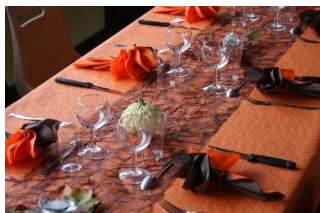
Chemin de table

Les élus de la commune qui ont mis tout en œuvre pour la réussite de cette manifestation, se réjouissent du succès de ces moments. En effet, partager un repas c'est aussi l'occasion pour les participants de se rencontrer, de resserrer les liens existants et d'en tisser de nouveaux.