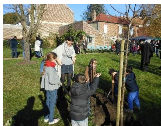
Nos enfants en pleine plantation