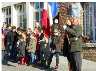
Ecoute de l'harmonie

Le Lundi 11 novembre 1918, 11 heures : dans toute la France, les cloches sonnent à la volée. Au front, les clairons bondissent sur les parapets et sonnent le "Cessez-le-Feu", "Levez-vous", "Au Drapeau". La "Marseillaise" jaillit à pleins poumons des tranchées.