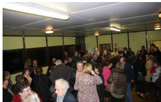
Merci de votre présence nombreuse