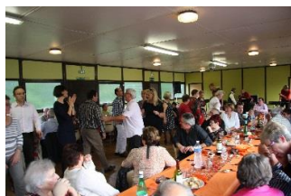
Quelques pas de danse