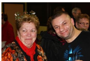
Une Reine, un courtisan