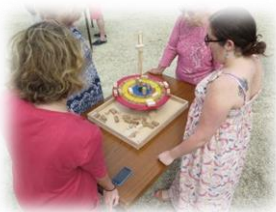
Agilité et stratégie !!!