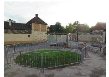
... mais gazon en devenir !!!

Au sein de la commission travaux, nous travaillons déjà sur les demandes de subventions pour l'an prochain : nous les renouvelerons pour les travaux de mise aux normes de la Mairie, pour l'étude de faisabilité d'une salle multifonctions rue du Château et étudions aussi le projet de reconfiguration de la place St Wandrille.