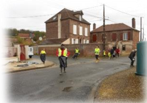
Dans notre village

Le 30 Avril 2016 matin, nous étions tous et toutes décidés à retrousser nos manches pour cette seconde édition " Opération Village Propre".