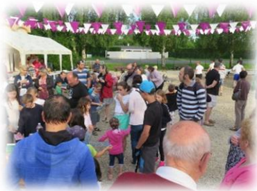
Fréquentation généreuse tout au long de la journée !!!

Le premier numéro de « La fête au Village » fut aux dires de tous un franc succès !