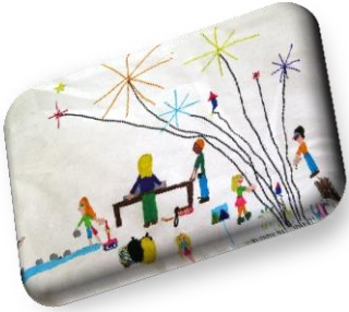
Merci aux enfants qui ont participé à la création des affiches.

Jeux de groupe ou individuels, de concentration ou de rapidité, d'adresse ou de stratégie...il y en a eu pour tous les goûts.