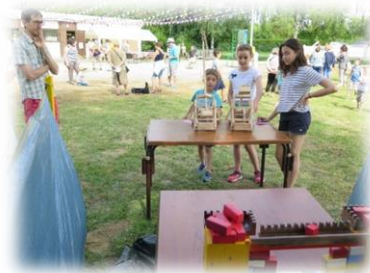
Tous aux abris !!!