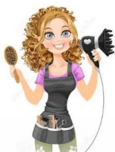
Faudra vous y fHair...

Nous sommes heureux de vous annoncer l'ouverture fin octobre du salon de coiffure et barbier "L'Atelier". Il vous accueillera au 3 bis rue des Fontaines et viendra ainsi agrandir la petite famille des commerces Rivecourtois qui comptait déjà le bar-tabac Le Saint Wandrille et le spa Ibidem. Cette arrivée contribuera à apporter encore plus de vie à notre village !