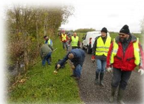
Sur les abords de la Conque