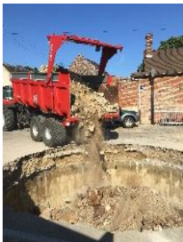
Tous les trous ne sont pas piscine...

Enfin, première étape de la reconfiguration de la place St Wandrille et pour ramener un peu de verdure dans le village ! La citerne sous la placette à l'entrée de la rue de la République a été rebouchée : le parterre sera bientôt borduré et recouvert de plantations.