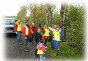
Sur les abords de la Conque

L'efficacité fut belle et bien présente mais la simplicité et la rapidité tristement pas face au bilan final : le second record de la journée est décerné à cette collecte abondante de déchets variés et d'immondes qui nous ont rappelé que la propreté n'est malheureusement pas le propre de l'Homme.