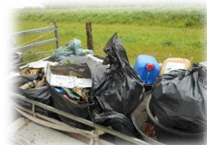
Une petite partie de la récolte

En plus d'avoir rempli l'ensemble des containers à déchets de la commune, 2 allers-retours à la déchetterie de Longueil Sainte Marie ont été nécessaires pour nous débarrasser de l'ensemble des débris collectés.