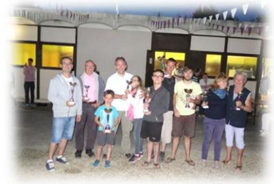
Les trophées des vainqueurs.

Cette réussite a été le résultat de la motivation et de l'investissement de nos associations, de notre équipe municipale et surtout de votre participation ! Rivecourt est certes une petite commune, mais nous avons prouvé qu'elle a une énergie incroyable, à l'image de notre feu d'artifice : magique !