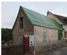
Le 26 rue de la République après sa mise en sécurité

En 2014, la mairie a acquis les "26-28 rue de la République". Le 26 a fait l'objet de travaux de mise en sécurité pour lever l'arrêté de péril.