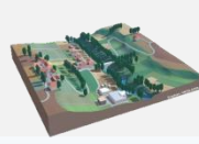
LES ENJEUX SONT MENACES PAR L'ALEA