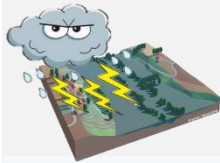
L'ALEA EST L'EVENEMENT MENACANT

Le risque naturel est une menace découlant de phénomènes météorologiques ou géologiques aléatoires par leur durée ou leur intensité (inondation, mouvement de terrain, tempête, cyclone, éruption volcanique, avalanche, feu de forêt, séisme). Le risque technologique est la menace d'une défaillance accidentelle d'une activité humaine (risques industriels, nucléaire, rupture de barrage, transport de matières dangereuses).