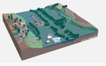
LE RISQUE EST LA CONFRONTATION ENTRE L'ALEA ET LES ENJEUX